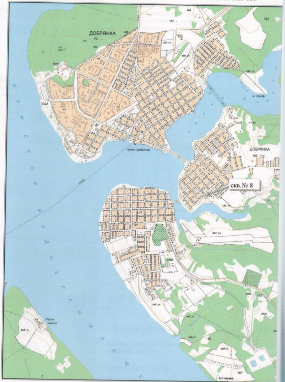
Схема расположения участка недр местного значения, содержащего в г. Добрянка Пермского края Масштаб 1:25 000