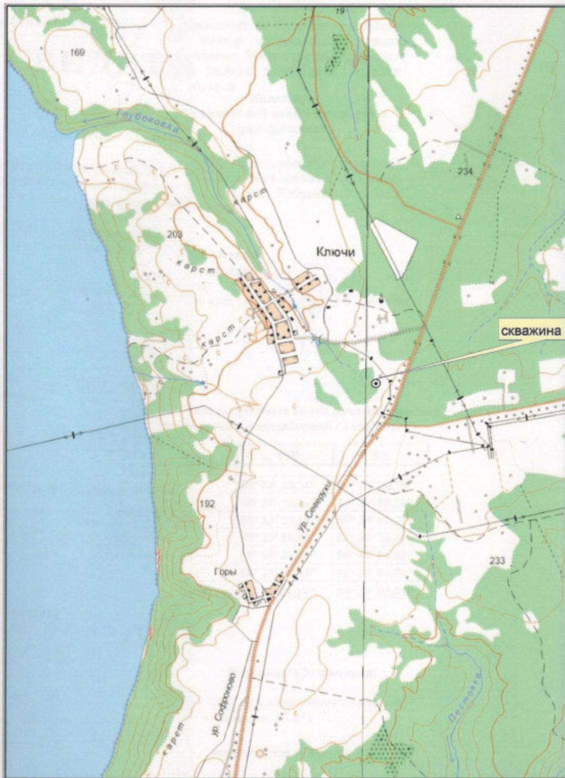
Схема расположения участка недр местного значения в д. Ключи Масштаб 1:25 000